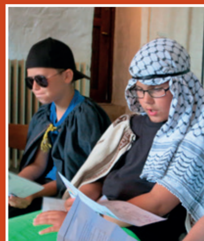
Hold øje med alle vores aktiviteter under Børnehjørnet