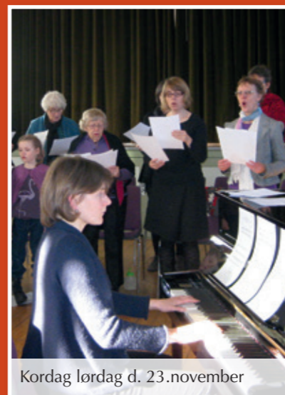
Kordag lørdag d. 23. november