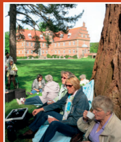
Fra udflugten til Rønninge Søgaard i foråret