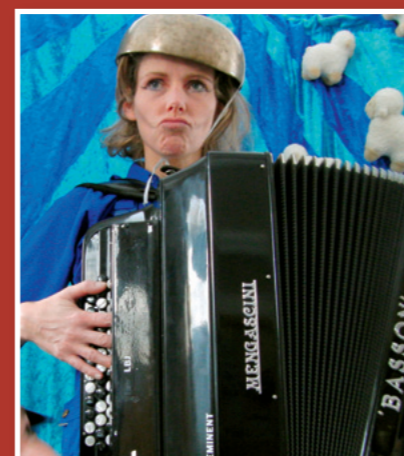
Kom til spaghettigudstjeneste i Fragde kirke d. 4-10 kl. 17: "David – superhelt i krig og kærlighed"