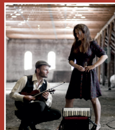
Hør Svøbsk vores lokale folkemusik-kergruppe til fyraftensgudstjeneste i Davinde kirke d. 2-10 kl. 17