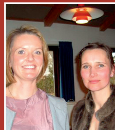
Pastoratets to præster: Bak dine kirker op og kom til vores orienteringsmøder i september!

Allerup Birkum Davinde Fragde Fragde Kærby Nørrebjerg Over Holluf Thorup